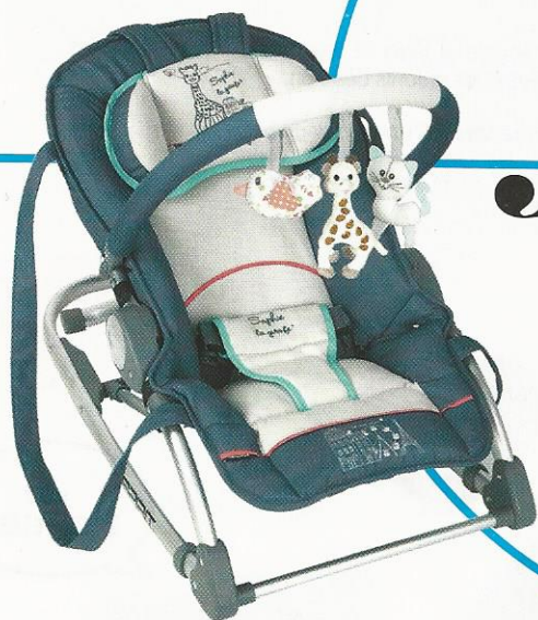
TRANSAT BALANCELLE Spirit, Sophie la Girafe® PARIS, Renolux , 89 €.

Le ballon rond est à l'honneur chez les bébés cette saison... Sur fond bleu-blanc-rouge pour soutenir nos champions à l'Euro 2016 !