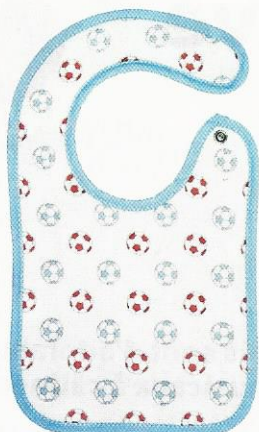
BAVOIR naissance en coton, Babycalin , 6,50 € le lot de 3 modèles.