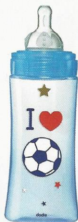
BIBERON anti-colique Initiation, col large, 6 mois et +, Dodie , 8,30 €.