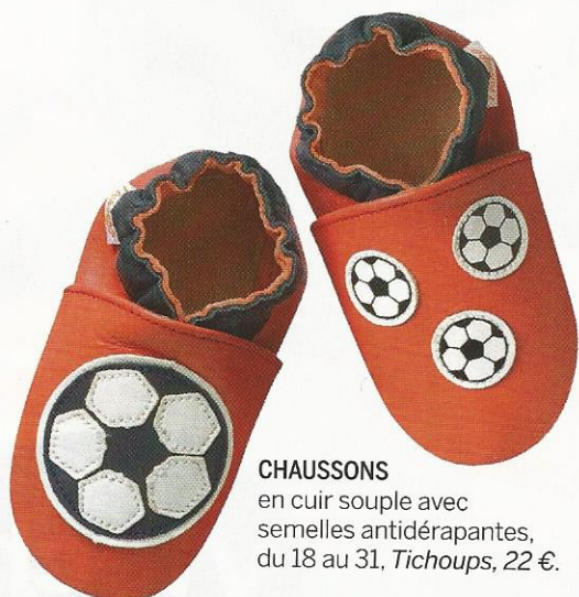
CHAUSSONS en cuir souple avec semelles antidérapantes, du 18 au 31, Tichoups , 22 €.