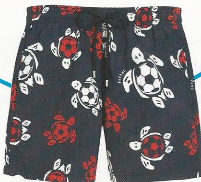
MAILLOT GARÇON Soccer turtle, assorti à celui de papa, Vilebrequin , 90 €.