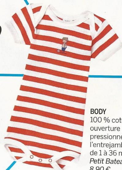
BODY 100 % coton, ouverture pressionnée à l'entrejambe, de 1 à 36 mois, Petit Bateau , 8,90 €.